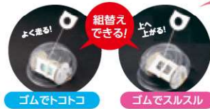
ゴムでトコトコ ゴムでスルスル